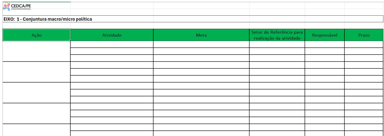
Quadro 05 – Quadro matriz de planejamento das ações CEDCA 2025

A referida matriz objetivou simplificar o processo de planejamento das ações e com isso contribuir com o monitoramento da execução das ações previstas.